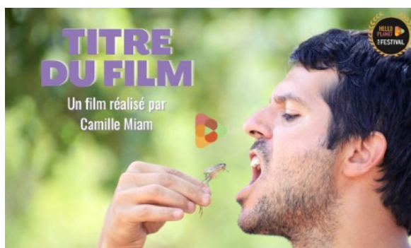
PHOTO EDITEUR , du réalisateur ou de la team (dimensions 600 px X 600 px). A fournir en format JPEG, JPG. Exemples :